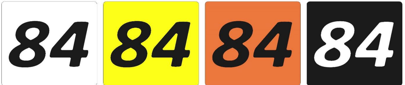
Bild 2 / Farblayout Start-Nr nach Kategorie von links nach rechts M0, M1, M2, M3